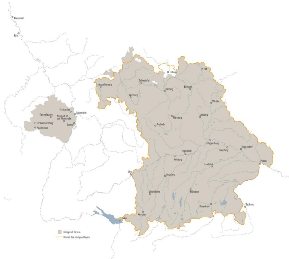
Karte 3: Das Territorium des Königreichs Bayern nach dem Wiener Kongress um 1819.