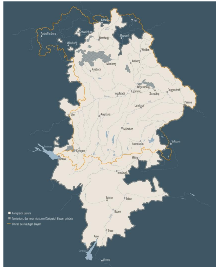
Karte 2: Das Territorium des Königreichs Bayern um 1808.