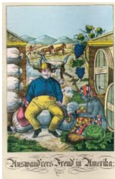
Karikaturen zur Auswanderungsthematik, um 1838 (Kat.-Nr. 3.12)

wo sie bisher besonders intensiv eingesetzt worden waren, unter Todesstrafe gestellt. 9 Bereits zu diesem Zeitpunkt nahm der Staat deutlich eine bevölkerungspolitische Selektion vor, denn bei genauerer Betrachtung fällt auf, dass „unliebsame“ oder unterstützungsbedürftige Untertanen, wie Juden, Ungläubige oder Bettler, von diesem Auswanderungsverbot ausgenommen waren oder man sie zumindest stillschweigend ziehen ließ. 10