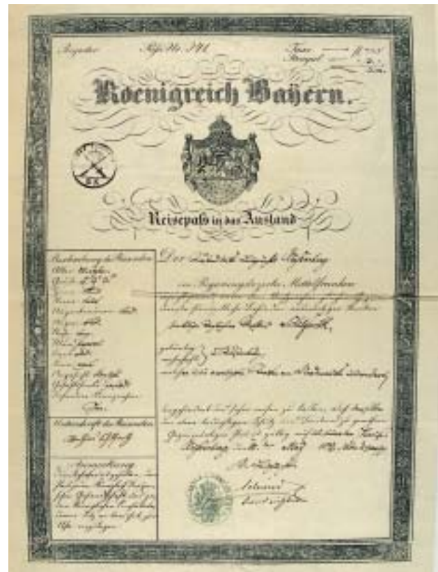
Reisepass des Königreichs Bayern in das Ausland, also für die Reise zum Auswandererhafen (Kat.-Nr. 3.28)

Während des Ersten Weltkriegs verschärfte sich die feindliche Stimmung gegen Immigranten, die durch die Welle der „New Immigration“ ausgelöst worden war. Nun wurde die Fähigkeit des Lesens und Schreibens zum entscheidenden Kriterium der Einwanderung. 28